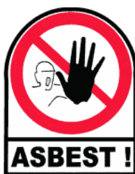
Verbotsschild nach den Unfall-Verhütungsvorschriften (UVV)