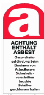
Warnhinweis nach UVV